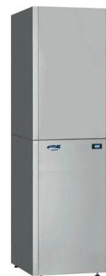
OPTIMUM 3 A 3 az 1-ben kompakt megoldás